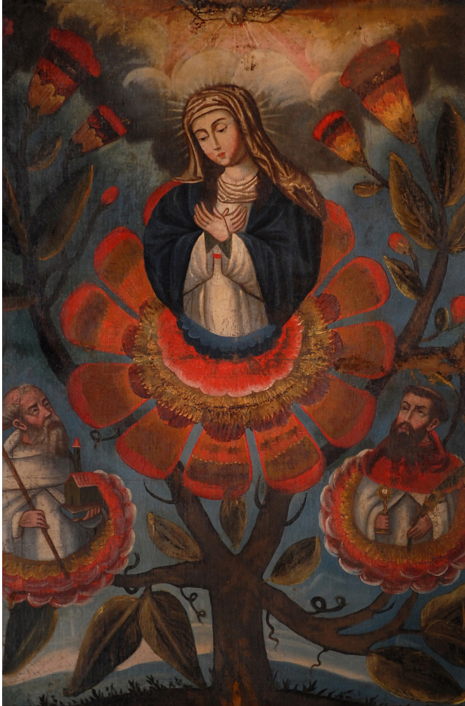
FIGURA 1. Virgen de la Merced con santos de la orden. Siglo XVIII. Archivo Museo de la Merced, Santiago.

ricas que introdujeron los religiosos consistían principalmente en los modelos de arte devocional europeos: el estilo renacentista y manierismo de las artes italianas, los grabados flamencos que marcarían tendencia en América, y posteriormente el barroco, de acuerdo con los parámetros artísticos exigidos por la Contrarreforma católica (cuyas doctrinas fueron puestas en ejecución en el virreinato gracias al Tercer Concilio Limense, celebrado entre 1582 y 1583). Como segunda consideración, cabe destacar que quienes realizaban el trabajo manual de las obras eran en su mayoría indígenas. Por ende, no es apresurado aventurar una identidad indígena para el artista del cuadro estudiado. Si bien el elemento indígena fue escasamente perceptible durante el siglo XVI y buena parte del XVII, para el XVIII se hizo notar en una búsqueda de originalidad y de distanciamiento con los modelos europeos inmediatos. Se puede sostener que la violencia y represión de la conquista cede paulatinamente