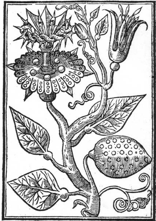
GRANADILLVS FRVTEX INDICVS CHRISTI PASSIONIS IMAGO.