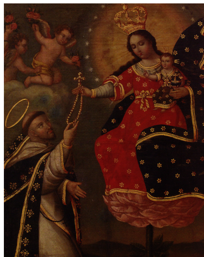
FIGURA 6. (derecha) Anónimo quiteño. La Rosa Mística entregando el Rosario a Santo Domingo , Siglo XVIII, Colección Museo O'Higiniano y de Bellas Artes de Talca.

información en torno al cuadro analizado, podríamos sugerir una interrelación (sin establecer directamente una relación causal) entre ambas piezas. Los gestos de ambas vírgenes coinciden plenamente, tanto en la dirección de la mirada y los párpados bajos, como en la particular posición de los brazos y el atuendo mercedario. La principal diferencia está en la ejecución tendiente al realismo pictórico y al claro oscuro que hacen de la obra del Museo de la Merced un cuadro barroco, mientras el trazo lineal del pincel de Vilca disminuye la profundidad de la representación. La candidez sonriente de su Virgen lo acerca más al modelo de Klauber, pero no está tan bien lograda la relación con la rosa que la sostiene, como resulta en la flor de nuestro cuadro anónimo. Las particularidades de esta obra, en contraposición con la de Surite, la acercan iconográfica y estilísticamente a un cuadro que también representa a la Virgen como Rosa Mística, pero sin pertenencia a ninguna serie de Letanías (Figura 6). En esta pintura anónima de la Escuela Quiteña, que al parecer arribó a Chile durante el siglo XVIII, se aprecia la flor como un verdadero trono para la Virgen coronada de reina, ligando la rosa y el rosario con una mística majestuosidad.