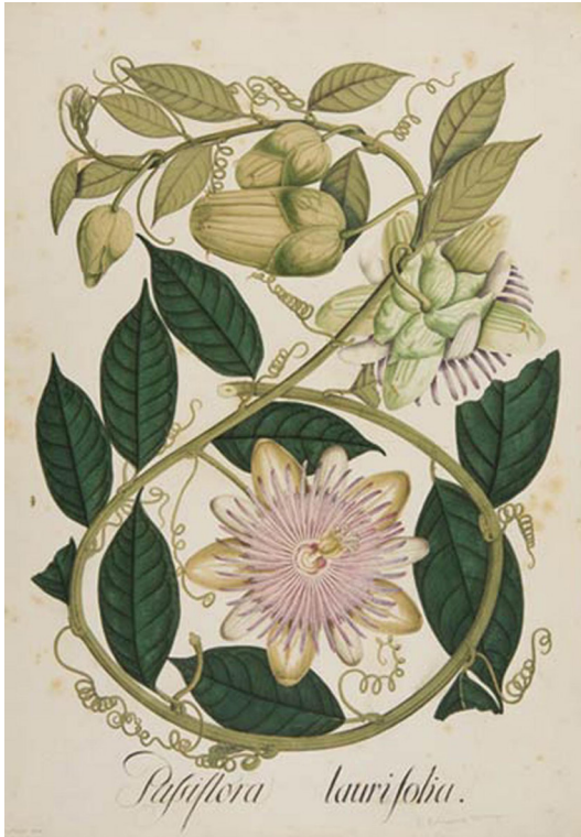
FIGURA 9. Passiflora laurifolia . Lámina de la Flora de Bogotá, Real Expedición Botánica de Nueva Granada.

este simbolismo transforman absolutamente los estambres en la corona de espinas y los estigmas en puntiagudas cabezas de clavos, como se aprecia en un grabado hecho por el jesuita G. Parkinson para el libro Paradisi in sole Paradisus terrestres , de 1629 (Figura 10). La importancia simbólica de la pasiflora probablemente retornó a las colonias hispanoamericanas, con su nueva impronta cristiana, a través de sermones y grabados. Algunos artistas flamencos como Jerome Galle y Karen van Vogelaer son una posible fuente de este traslado. Una particular interpretación del simbolismo de la pasión en la pasiflora es la de Antonio de León Pinelo, Cronista Mayor de Indias entre 1658 y 1660. En su libro El paraíso en el Nuevo Mundo , de 1656, intenta demostrar que el Edén bíblico se hallaba en tierras americanas y para ello identifica el «árbol del bien y el mal» con la planta norandina Passiflora ligularis . El fruto prohibido era para el cronista la dulce granadilla: «¿Pues qué mayor prueba de que esta fruta fue la del pecado, y la que ocasionó el castigo, que hallarse en su Flor las más presisas señales del perdón?» (cit. en Gisbert, El paraíso 163).