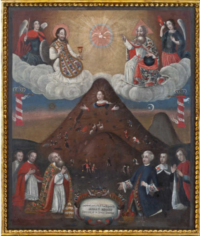
FIGURA 8. Anónimo. Siglo XVII. Museo de la Moneda, Potosí, Bolivia.

la relevancia de las flores en el Imperio Inca, sin embargo, no he hallado vestigios iconográficos o arqueobotánicos que den cuenta del uso ceremonial o medicinal de las Passifloráceas ni en los incas ni en civilizaciones anteriores como Chavín, Moche