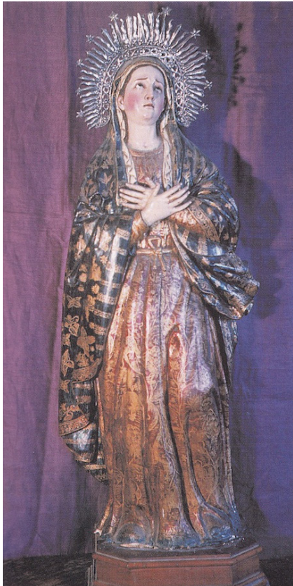
FIGURA 11. Dolorosa, Escultura quiteña. Siglo XVIII. Monasterio de la Encarnación de Lima.

Su soledad debe ser puesta en relación con el motivo floral que unifica la composición. Volviendo a la pregunta sobre las proporciones: ¿estamos ante una flor gigante o una Virgen diminuta? El paisaje cordillerano del fondo pareciera indicar más bien lo primero, aunque es posible dar con esa proporción entre una flor y su entorno con un estudio adecuado de la perspectiva.