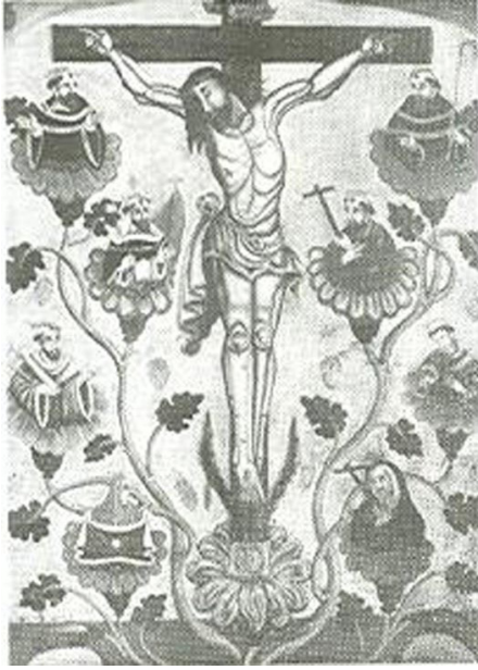
FIGURA 7. Paredes. Crucifixión sobre Árbol Florido , 1799.

la sangre de Cristo» (Stastny 18). En 1521 este motivo conformó el frontispicio del popular santoral Flos Sanctorum de fray Pedro de Vega, monje español. En él aparece Cristo crucificado en el árbol florido, rodeado de santos y santas que emergen de los diversos capullos que forman parte del árbol. La misma composición se encuentra en los primeros murales de los conventos mexicanos, como también la repiten algunos artistas andinos. Es el caso de una pintura de 1799 firmada por «Paredes» en Cajamarca, en la cual ocho bustos de santos «brotan» sobre las flores del árbol (Stastny 19) (Figura 7) 5 . Al igual que en el cuadro que nos interesa, las figuras de alrededor observan devotamente a la figura religiosa que ocupa el lugar central, divinidad que también se sitúa sobre una simbólica flor.