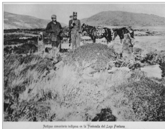
5. «Antiguo cementerio indígena en la península del lago Fontana». Excursión a la Patagonia y a los Andes (1902) de Aarón Anchorena.

dos tópicos exóticos: el indígena y la cacería del particular animal. La escena permite el desplazamiento de sentido entre muerte animal y la «extinción» indígena. Recordemos la sucesión de figuras retóricas antes citadas: «últimas reliquias que aún subsisten de las razas primitivas..., o que se extinguen gradualmente...». En la cacería de huemules en el Lago Fontana los expedicionarios ocupan dieciocho días, los que en el contexto del álbum se presentan como el momento de clímax de una secuencia cerrada por la descripta. Un poco más adelante otra imagen realiza un comentario suplementario o una coda a esa retórica de muerte y extinción. Anchorena cruzó en balsa el lago y en su otra orilla encontró un cementerio indígena. «Antiguo cementerio indígena en la península del lago Fontana», aclara el epígrafe de la foto que lo muestra sin su escopeta ante los montículos y en actitud reflexiva. A su lado, un soldado que oficiaba de ayudante posa con una pala sobre su hombro. El cacique ha desaparecido de la secuencia; se suma el cementerio y su explícita excavación (profanación); «extrajimos algunas curiosidades» (9), dirá el viajero (lámina 5).