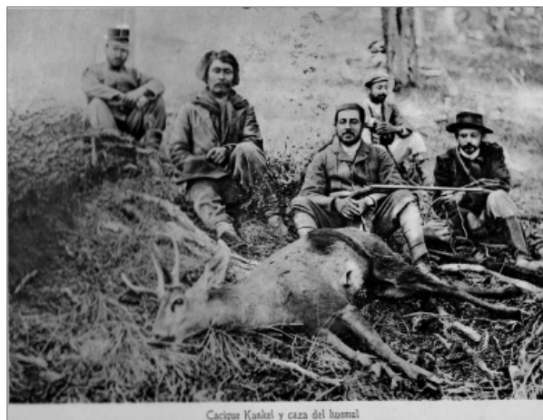
4. «Cacique Kankel y caza de huemul». Excursión a la Patagonia y a los Andes (1902) de Aarón Anchorena.