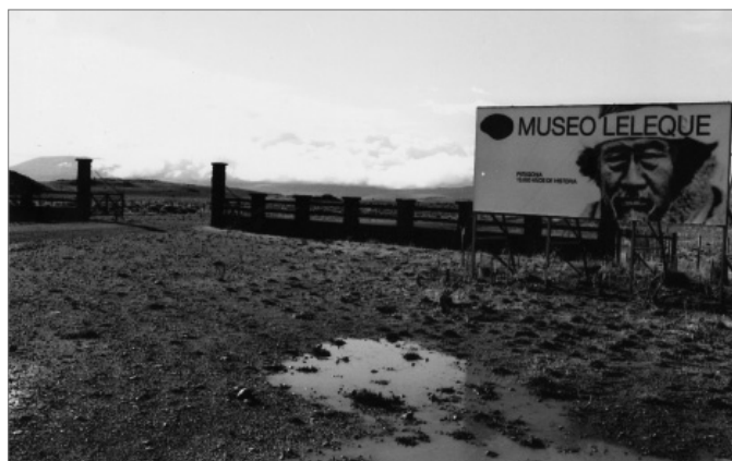
1. Epígrafe: Entrada al Museo Leleque (Provincia de Chubut, Argentina).