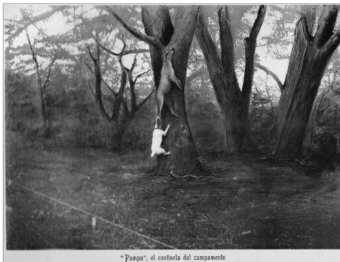
2. «Pampa» centinela del campamento». Excursión a la Patagonia y a los Andes (1902) de Aarón Anchorena.

Entre la ciencia natural y la política militar, en la toma del espacio patagónico, el paisaje desierto fue objeto también de una mirada que, aunque relacionada con esas dos experiencias, se fundaba en un proceso de percepción burguesa desprovista de los imperativos positivistas y patrióticos. Entre 1870 y 1900 aproximadamente, las experiencias de los hacedores de esos paisajes eran «híbridas». El militar era naturalista, el naturalista era viajero y todos escribían con participación en la política nacional como producto de su posición de clase burguesa y letrada. El paisaje no fue ajeno a la cultura de esa clase, fue un capítulo especial de su educación estética y del afianzamiento de la idea de individuo. Al respecto, el antecedente más notable es el lugar del paisaje en la pintura del romanticismo como ingreso a la meditación sobre el lugar del individuo ante el destino azaroso señalado por las fuerzas de la naturaleza.