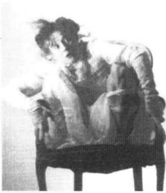
Petites comédies rurales, de Roland Fichet, puesta en escena de Annie Lucas.