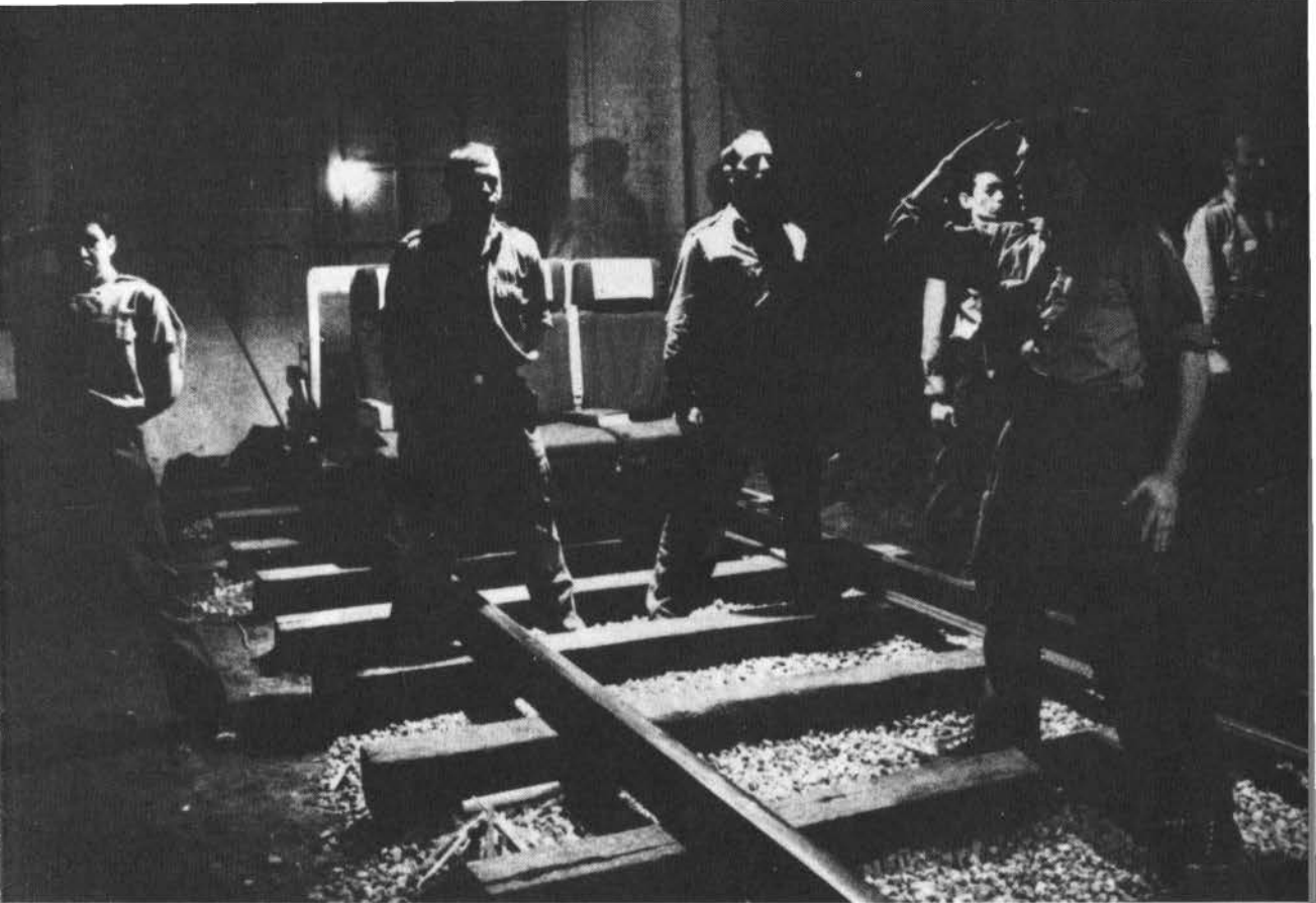
Le Rail, Quebec, 1985