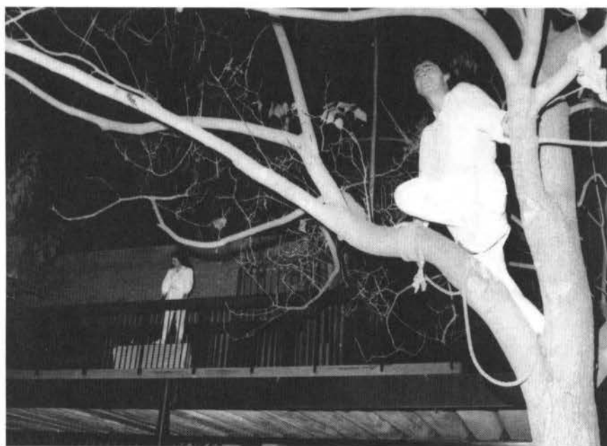
"Romeo y Julieta", Teatro 'Q'.