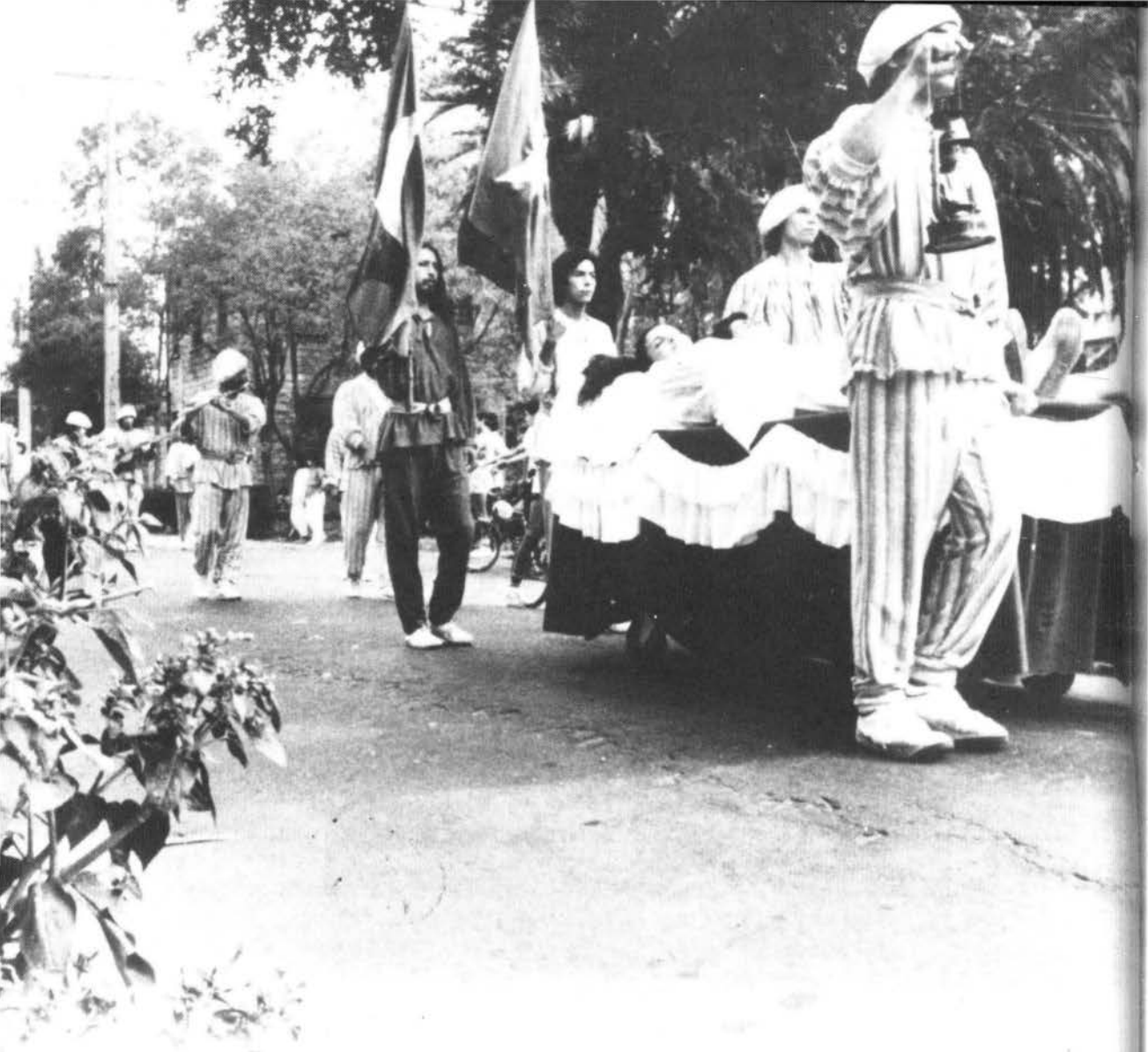
"Romeo y Julieta", Teatro 'Q'.