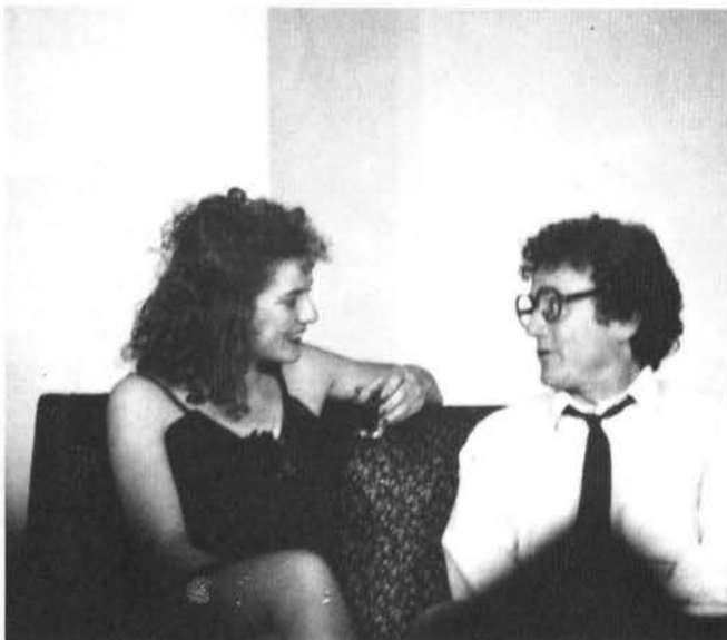
"Sueños de un Seductor"