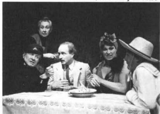
"El Hombre, La Bestia y La Virtud"