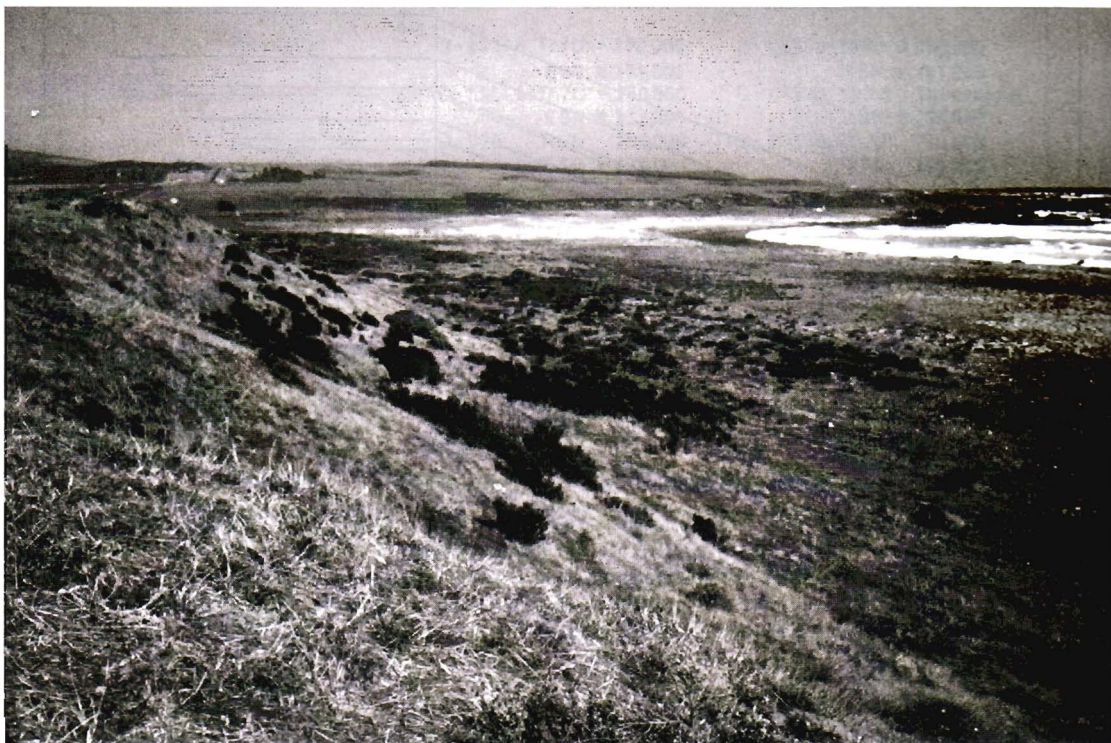
Fotografía 1: Los Quinquelles (32°15'S), al sur de Pichidanguí. Vista de las más baja terraza marina y del acantilado muerto que la separa de la terraza correspondiente al último período interglacial (interestadio isotópico Se, hace 125 000 años). La terraza fue ocupada durante la culminación de la transgresión holocénica, hace 5 o 6.000 años. Sin embargo, fue probablemente labrada por una transgresión previa correspondiente al interestadio isotópico Sa (80 000 años) durante el cual el nivel del mar se acercó de su nivel actual sin alcanzarlo.

2.500 km más al norte. Se abre así una posibilidad de correlación para una de las terrazas marinas de la costa del centro y del norte de Chile.