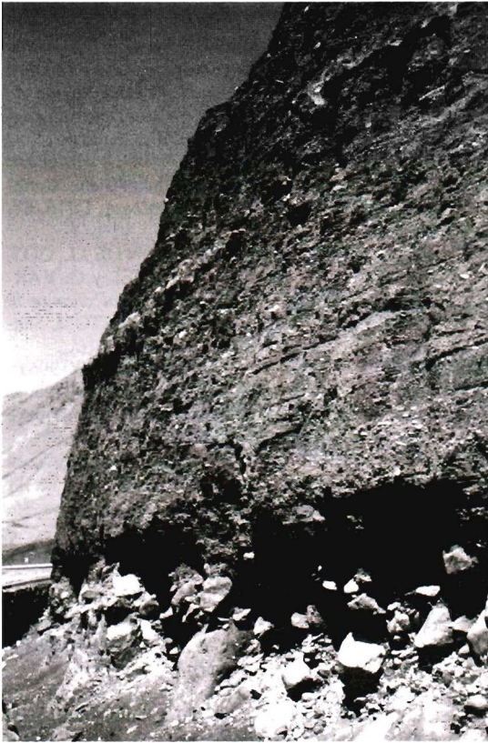
Fotografía 2 : Caleta Coloso (23°45'5). Los depósitos de playa fosilíferos que afloran a 6 m por encima del nivel marino actual y que corresponden a la última época interglacial (interestadio isotópico 5e, 125 000 años) fueron cubiertos por materiales continentales, de unos diez metros de espesor, durante una fase de regresión del mar. Esta formación detrítica forma un cono de deyección que evidencia la ocurrencia de un período menos árido que el actual y que podría corresponder al estadio isotópico 2.