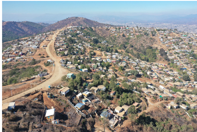
Figura 3. Campamentos en Viña del Mar.

El trazado y dimensiones de calles y veredas, orientación de viviendas, diseño de espacios públicos, conexión con redes de infraestructura urbana, son obras de urbanización realizadas por los habitantes que despliegan saberes sobre construcción transmitidos por generaciones. Son también experiencias sobre procesos de urbanización que se transmiten desde otros campamentos del Área Metropolitana de Valparaíso.