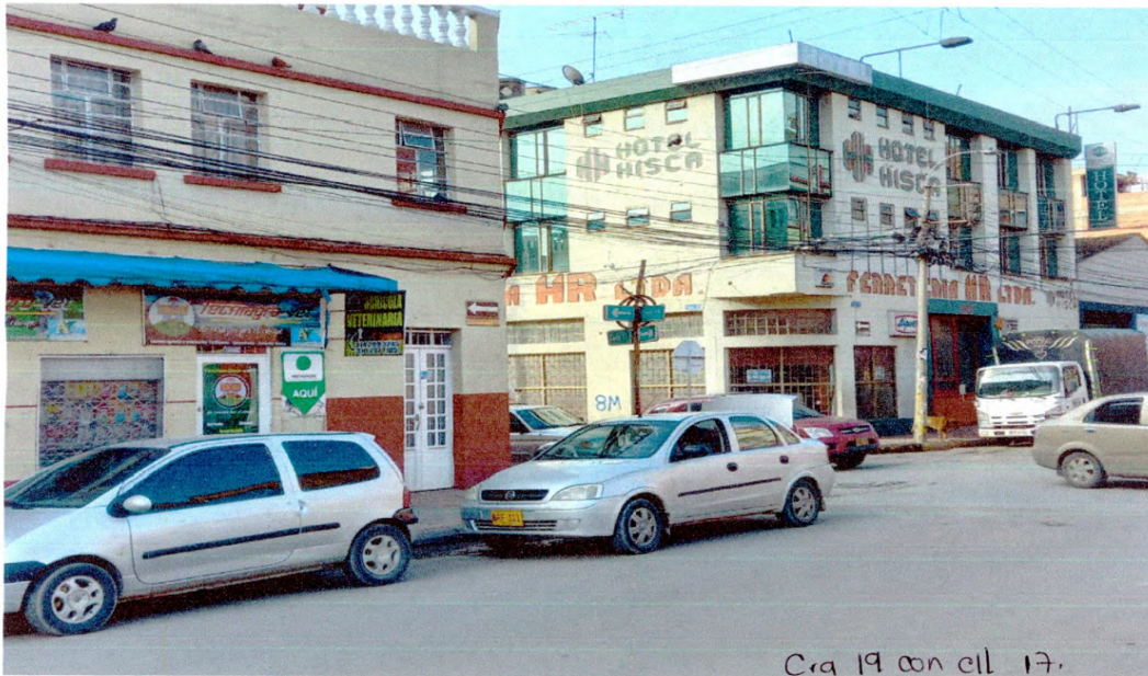
Fotografía 2. Calle 17 entre carrera 19 y 20 148