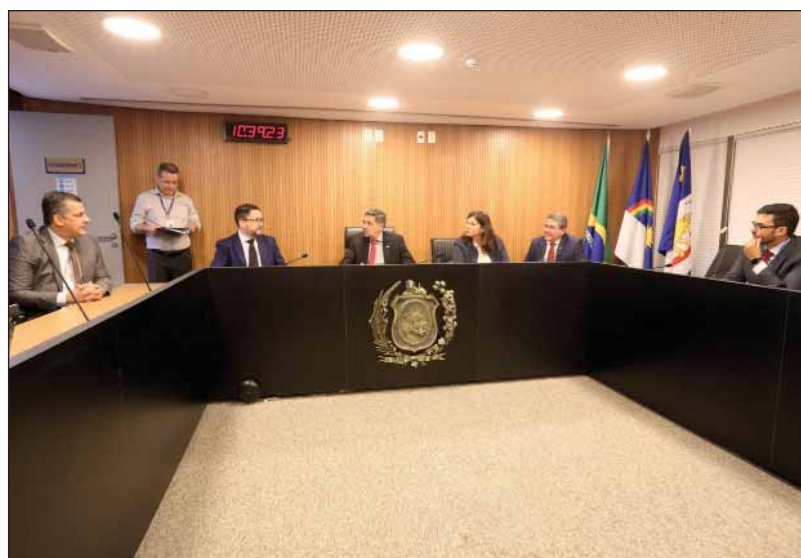
REUNIÃO - Colegiado ouviu ontem uma explanação do secretário estadual de Desenvolvimento Econômico

O secretário esclareceu também que o estudo de viabilidade da obra usado para embasar a mudança de traçado não aponta necessariamente para a exclusão do eixo até Suape. Segundo ele, a decisão foi uma dentre as várias possibilidades apontadas no documento, que analisava