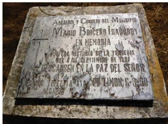
FIGURA 4: PLACA CONMEMORATIVA EN MEMORIA DE LAS VÍCTIMAS DEL DESASTRE DE EL LIMÓN DEL 6 DE SEPTIEMBRE DE 1987, DISPUESTA POR LA ALCALDÍA Y CONSEJO DEL MUNICIPIO MARIO BRICEÑO IRAGORRY 46

Hubo escasas manifestaciones materiales de aquel evento, una de ellas, que forma parte de los “vehículos de la memoria”, en este caso de la memoria histórica, fue la placa conmemorativa (véase Figura 4) que dispuso la Alcaldía y Consejo del municipio Mario Briceño Iragorry, en memoria de las víctimas del Desastre de El Limón del 6 de septiembre de 1987, justo al cumplirse tres años de aquel fatídico domingo.