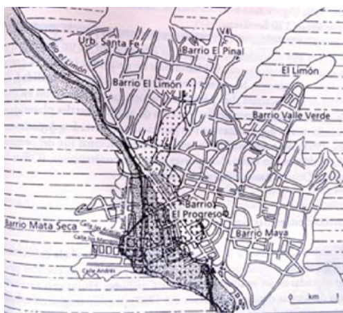
FIGURA 3: ZONA AFECTADA DE LA POBLACIÓN EL LIMÓN 35

Todo el sector de El Limón se encuentra sin energía y las pérdidas son calculadas en varios millones de bolívares. Gran cantidad de comercios resultaron inundados y por consiguiente con la pérdida de todas las mercancías 34 .