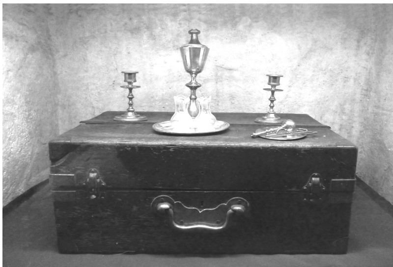
Museo de Arte Religioso Juan de Tejada (Córdoba, Argentina), ficha N° RCI 094. Medidas: 25 x 50 x 20 cm.