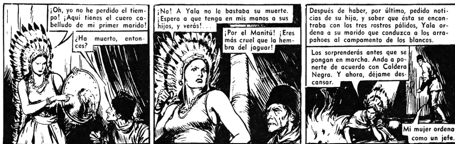
Imagen N° 3: Yala, madre de Minehaha, gobierna con crueldad y firmeza. Aunque bella, su expresión facial muestra el odio que la motiva: Okey , N° 158, Santiago, 9 de agosto de 1952.