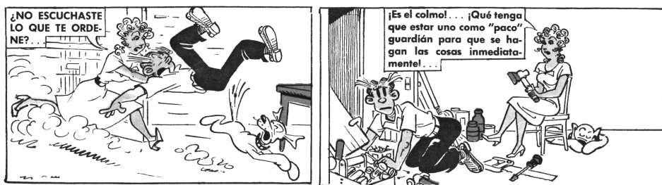
Imagen N° 2: El poder femenino en “La Familia Pirinola”: Okey , N°690, 28 de octubre de 1962.

El hecho de que las esposas dominantes aparezcan en historietas cómicas puede ser indicativo de que el tema se transforma en curioso y risible solo invirtiendo el orden habitual de las cosas. En todo caso, también parecer haber detrás de esta serie un intento por cuestionar los avances del feminismo, caricaturizando los cambios en las tradicio-