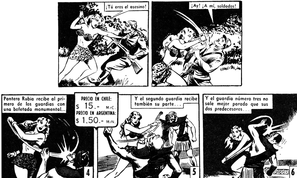
Imagen N° 5: Algunas escenas de golpizas, con Pantera Rubia como protagonista: Okey , N° 167, Santiago, 11 de octubre de 1952 y N° 274, Santiago, 30 de octubre de 1954.

Pantera es una joven que vive en Borneo, desconociendo su origen. Se sabe que Flor de Loto la ha criado desde niña para protegerla de la muerte que afectó a su familia en Sumatra, a manos de la poderosa Reda. Vive junto a un fiel orangután, Tao, que siempre la acompaña. Se comporta con audacia, demostrando fortaleza e, incluso, rudeza. Combate cuerpo a cuerpo, derriba a poderosos rivales y casi siempre resulta vencedora. En cuanto al lenguaje, agrede verbalmente a sus contrincantes con expresiones como “insecto” e “idiota” (312); “¡Lo mataré como a un perro!” (191). En todo caso, en la serie en su conjunto predomina este tono duro y no solo en la joven 49 . Abundan las escenas en que ella y otros personajes actúan con violencia: estocadas y flechazos en el cuello y en el estómago, caídas mortales desde precipicios y mutilaciones, golpes de pies y puños, por citar algunas situaciones características, además de múltiples amenazas (imagen N° 5) 50 .