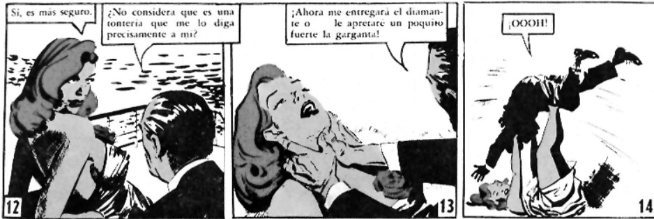
Imagen N° 8: Secuencia del episodio “La rosa azul”, donde Carmen muestra su destreza en el jiu-jitsu: Okey , N° 525, Santiago, 28 de agosto de 1959.

Otro rasgo peculiar en esta historia es el énfasis que se pone en la poca fragilidad emocional de las protagonistas. Son bellas, seducen con facilidad, pero no se rinden frente a los hombres ni sufren por ellos. En “Las estrellas también caen”, Carmen se encuentra con Duke, un antiguo amigo que la corteja, quien la ayuda a desentrañar el problema que enfrenta. Al final de la historia, Duke le pregunta si volverá a verla y ella responde, con simpatía y distancia: “Con los ojos del alma, amigo mío” (731). Este modelo de mujer algo indiferente al compromiso, aunque sensual y provocadora, que disfruta de la vida, sin planes de matrimonio, fue cada vez más frecuente en la época. Las historias que concluían en noviazgo y matrimonio siguieron existiendo, pero frente a ellas aparecieron estas mujeres modernas y arrolladoras, alejadas de esos proyectos.