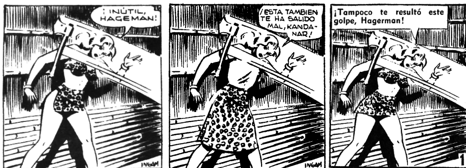
Imagen N° 4: Tres adaptaciones del mismo cuadro de Pantera rubia. A la izquierda, la versión mexicana ( Simba, la Amazona , N° 8); al centro, la española (serie La Selva 13, Pantera rubia , N° 9) y a la derecha, la chilena ( Okey , N° 221, 24 de octubre de 1953). Las dos primeras aparecen con la firma de Ingam, mientras en la última esta ha sido borrada.

éxito 44 . El insinuante traje, que cubría mínimamente a la temperamental y ruda protagonista, así como la violencia desplegada en varias acciones, provocaron gran revuelo. En los últimos episodios de la serie ya fue posible observar cambios en la vestimenta de la protagonista, al sustituirse el diminuto taparrabo por un traje de una pieza y luego por una falda larga. Desde Italia pasó a España, bajo el título de “Pantera Rubia”, enfrentando similares problemas, en este caso con la censura franquista, lo que provocó una fuerte intervención en los contenidos, en particular ajustes en el vestuario y en algunas escenas violentas (imagen N° 4).