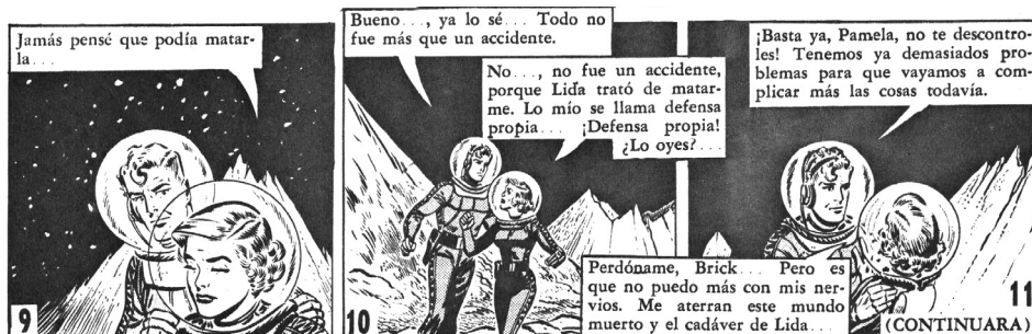
Imagen N° 1: Los problemas generados por Pamela Parker, acompañante ocasional de Brick Bradford: Okey , N° 589, Santiago, 18 de noviembre de 1960.

perdidos y sin comida, Diana comenta: “Si hubiera estudiado economía doméstica en vez de geología, seguramente no me vería en estos apuros” (273). Con Pamela Parker, otra bella joven enamorada de Brick, las cosas no mejoran: en una aventura, ella se impacienta y el héroe le recrimina su nerviosismo (imagen N° 1).