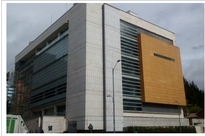
Figura 1. Vista Noroccidental del edificio Centro Ático

La arquitectura del edificio, tal como se muestra en la Figura 1, combina un concreto a la vista con un enchape en piedra royal veta y grandes fachadas en vidrio, una cubierta plana con elementos que permiten la entrada de luz natural al interior del edificio y una pequeña porción de cubierta verde.