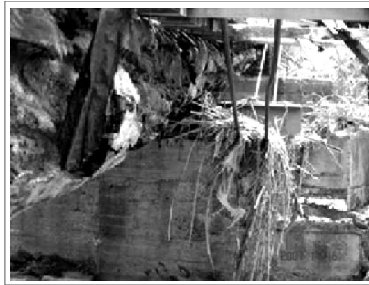
Figura 8. Desintegración de la madera de la estructura principal