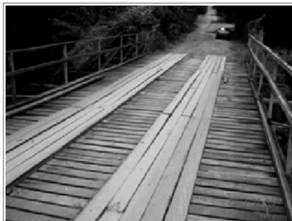
Figura 7. Vista de la losa Figure 7. View of the slab

It is recommend for the maintenance of this bridge that the cables to be properly protected from corrosion and tensioned as well. In addition, the logs of the guardrail should be replaced quickly.