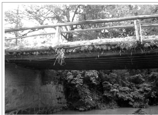
Figura 2. Vista general del puente Figure 2. Bridge overview

This bridge is located adjacent to the Joaquim Egídio road, and is a connection for the district environmental station as well as for regional agricultural farms. Its main traffic is constituted by cars and small trucks. The bridge was built with steel girders and timber logs, transversally, forming a grid for the slab (see Figure 2), composed of a layer of soil. The joints are constituted of stone blocks and mortar.