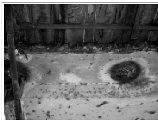
Figura 6. Estado de desintegración de la acera Figure 6. State of decay of walkway

This bridge is part of the heritage of the city of Campinas and a risk to the population needing an urgent maintenance. Corrosion of metal profiles requires treatment of the substrate for removal of corrosion products and impurities as well as applying anti-corrosive paints in sections where it is necessary to replace material. The replacement of much of the board of pieces of treated wood also is required.