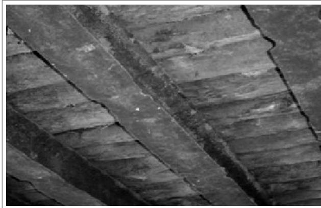
Figura 3. Corrosión del acero Figure 3. Steel corrosion

As a suggestion to improve or maintain the structural function of the bridge is to replace the superstructure of this bridge by a composite structure of concrete and steel or wood. Thus, the concrete slab contributes to the resistance would be beneficial as higher load capacity and eliminate problems as vegetation on the bridge and moisture retention, which causes the rotting of logs.