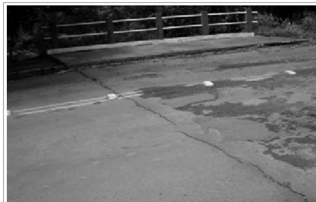
Figura 4. Deterioro del pavimento Figure 4. Deck deterioration