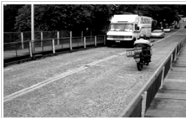
Figura 5. Vista del tráfico Figure 5. Traffic view

Built over the Atibaia River, in the district of Sousas, the bridge is the main connection between the two district, without mentioning that this is the optimized route to arrive the district of Joaquim Egídio. The bridge serves as a constant pathway of cars, buses and trucks according to Figure 5.