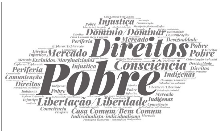
Figura 1: Nuvem de palavras com as expressões utilizadas pelo papa Francisco

a realidade de desigualdade a que os povos estão submetidos e aponta para a necessidade de lutar pelos direitos daqueles que são marginalizados pela sociedade.